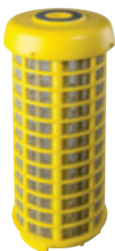
RAH 90 mcr nerez